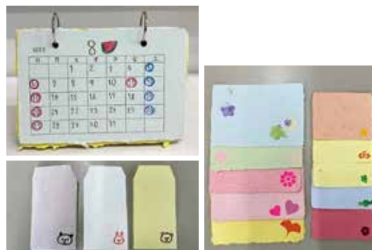
作業学習（紙工班の作品）