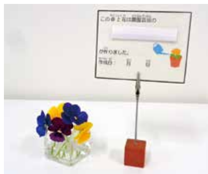
作業学習（卓上花の設置）