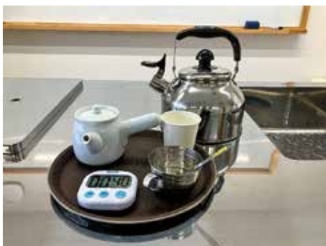
職業・家庭（お茶を淹れる学習）