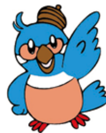
七生特別支援学校 マスコット なっぴい