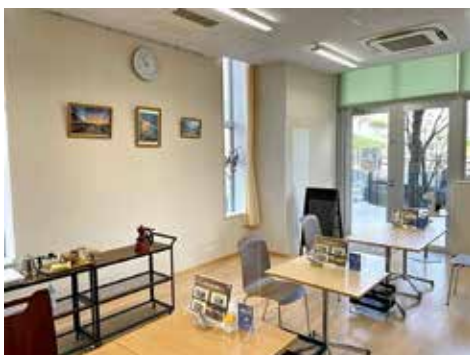
作業学習（レインボーカフェ）